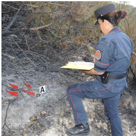
Carabiniere Forestale impegnato nelle fasi di repertazione con il Metodo delle Evidenze Fisiche (MEF), utilizzato per risalire al punto di origine dell'incendio.